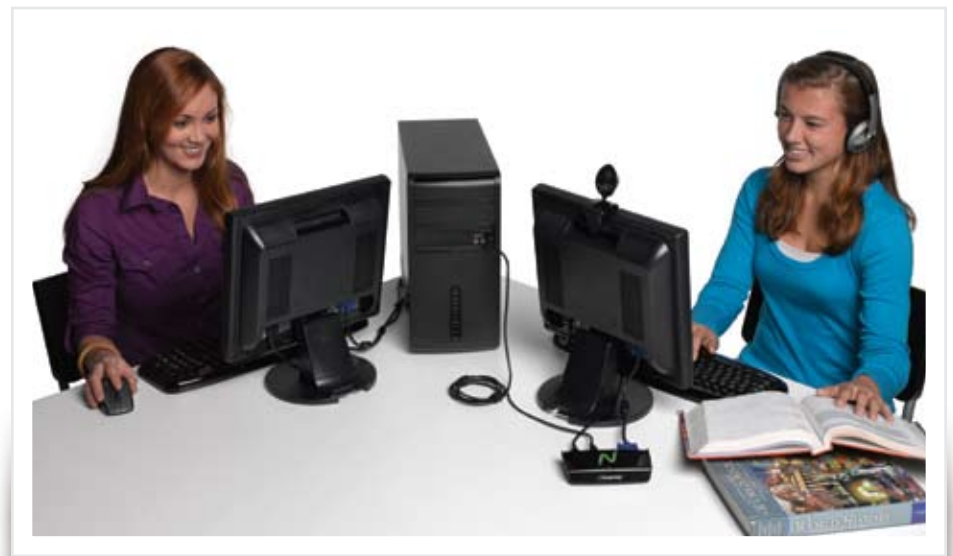
O U170 é ideal para salas de aula, acesso público, pequenas empresas, assinatura digital e uso doméstico.

A virtualização de desktop não precisa ser complexa. Nem cara. Ao contrário de outras soluções de virtualização de desktop, a NComputing não precisa de servidores nem de infraestrutura cara e complicada. Na verdade, o vSpace foi projetado para compartilhar, de forma eficiente, os ciclos de CPU normalmente desperdiçados em PCs padrão de baixo custo. Em uma solução NComputing, o vSpace cria vários espaços de trabalho virtuais em um único computador físico, e os usuários adicionais conectam seus monitores, teclados e mouses através de um simples dispositivo de acesso. Com o U170, não poderia ser mais fácil conectar o dispositivo de acesso ao computador compartilhado: basta encaixar um no outro com o cabo USB incluído.