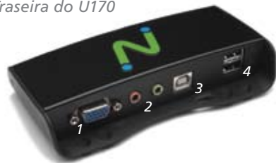
Traseira do U170

Furos de montagem de 75mm e 100mm compatíveis com VESA (parafusos de montagem incluídos)